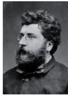
Georges Bizet (1838 -1875)

Georges Bizet „Te Deum“ für Soli, Chor und Orchester