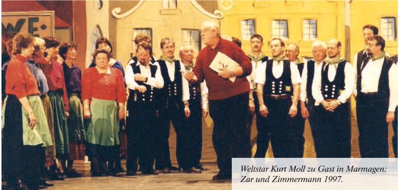
Weltstar Kurt Moll zu Gast in Marmagen: Zar und Zimmermann 1997.