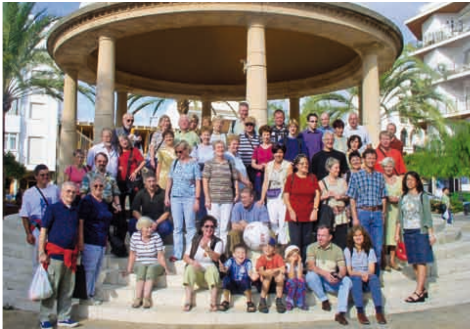
Auf Konzertreise in Estepona/Costa del Sol Oktober 2004