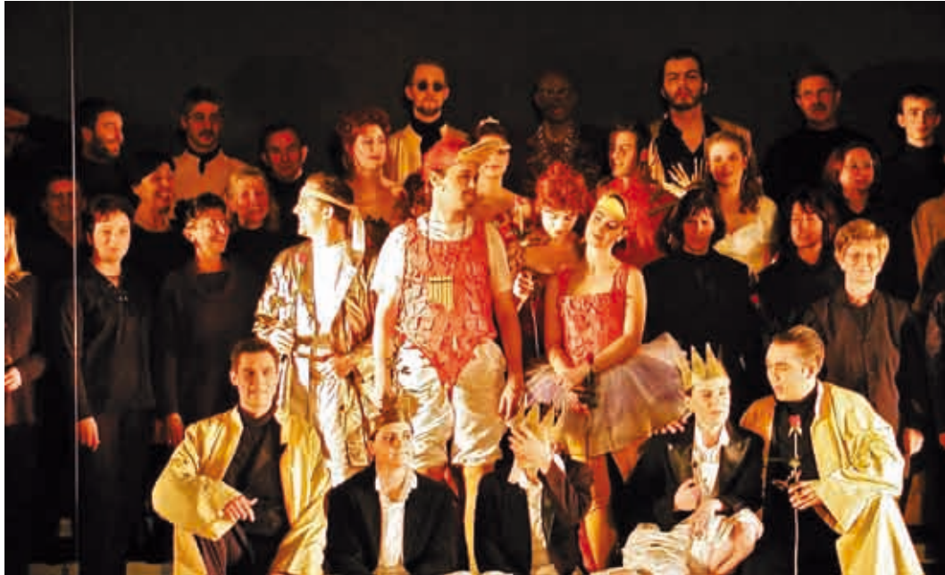
Zauberflöte 2003: Strahlende Gesichter beim Schlussapplaus