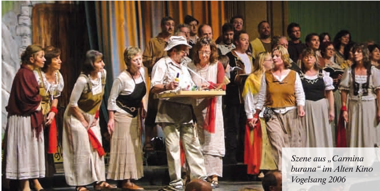
Szene aus „Carmina burana“ im Alten Kino Vogelsang 2006