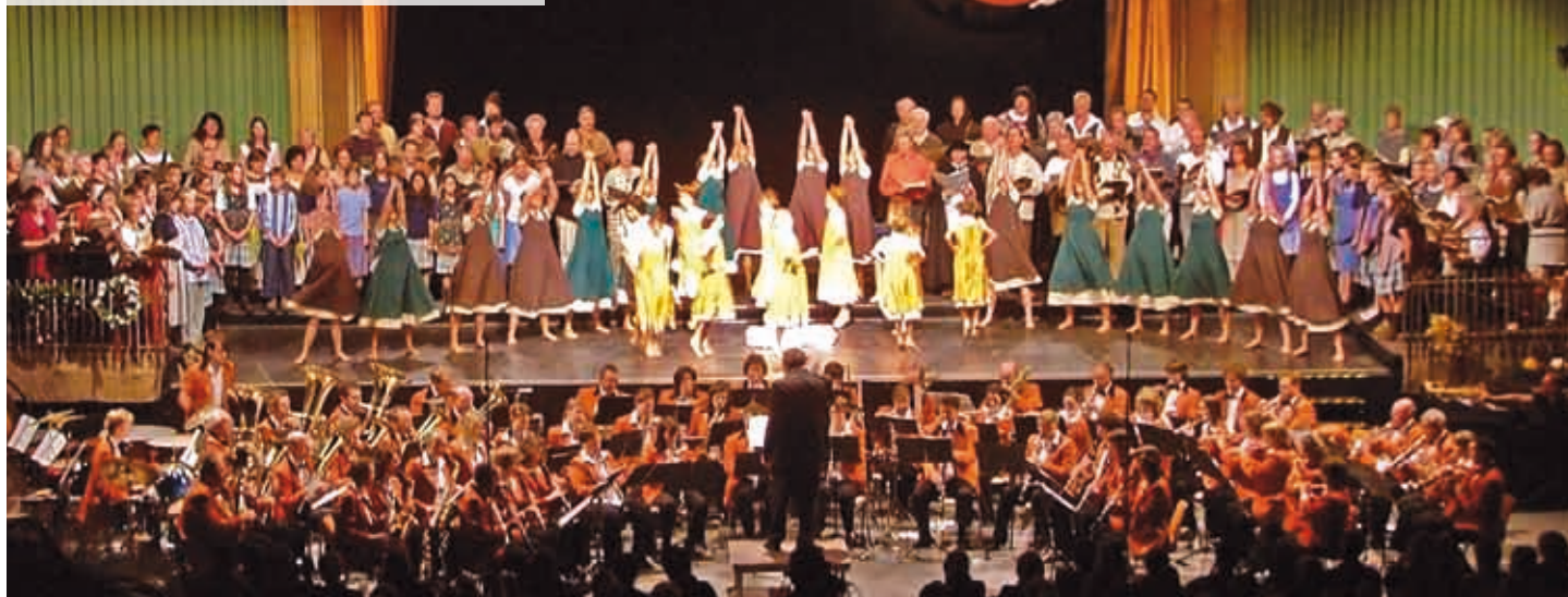
Schlusszene aus „Carmina burana“ im Alten Kino Vogelsang 2006